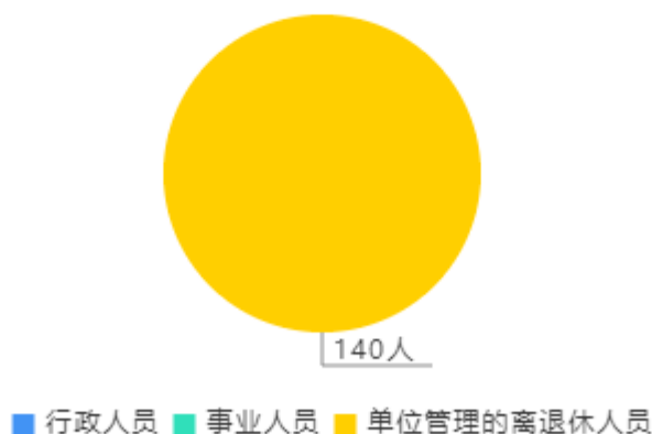
人员情况构成饼图

截至上年底，本单位人员编制0人，其中行政编制0人，事业编制0人；实有人员0人，其中行政0人，事业0人。单位管理的离退休人员140人。