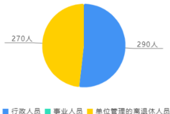
人员情况构成饼图

截至上年底，本单位人员编制0人，其中行政编制0人，事业编制0人；实有人员290人，其中行政290人，事业0人。单位管理的离退休人员270人。