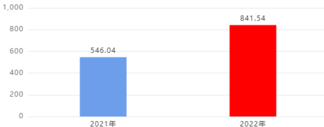
财政拨款收入、支出总计对比图（单位：万元）