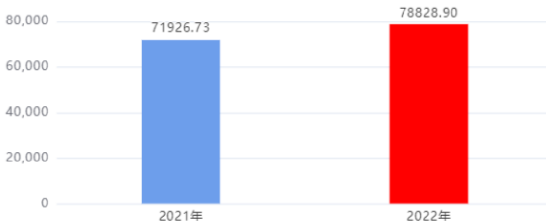
财政拨款支出对比图 (单位: 万元)