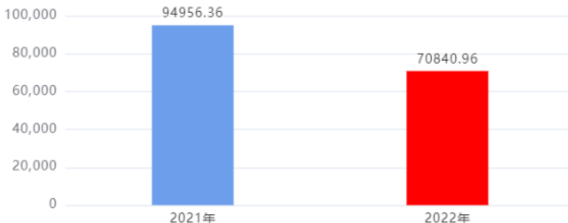
财政拨款支出对比图 (单位: 万元)