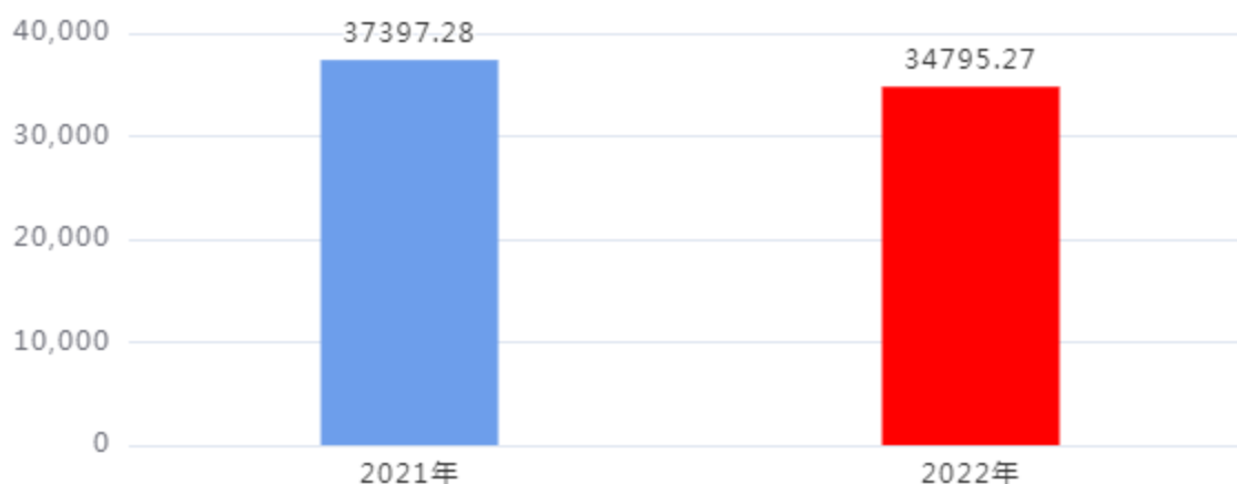
财政拨款收入、支出总计对比图（单位：万元）

2022年度财政拨款收入总计、支出总计均为34,795.27万元，与上年相比收入总计、支出总计均减少2,602.01万元，下降6.96%，下降的主要原因是：受疫情影响，厉行节约，压缩收支。