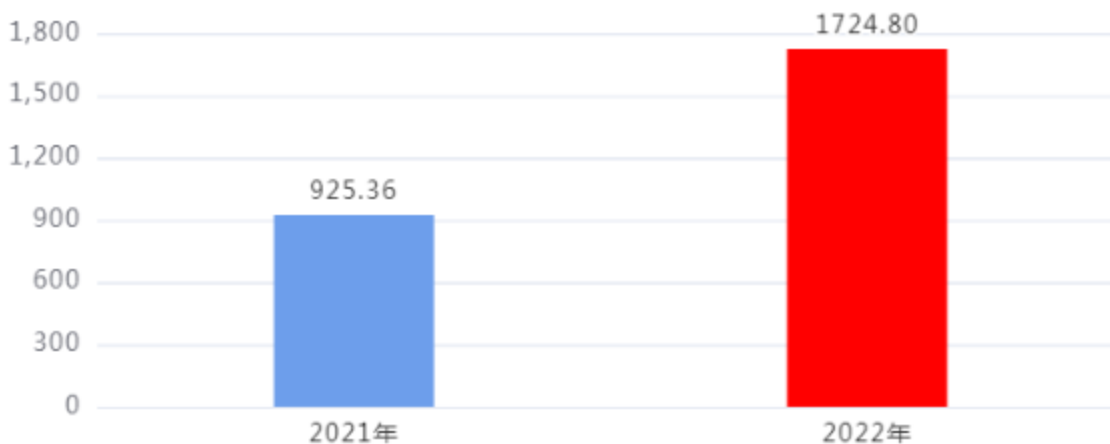
财政拨款支出对比图（单位：万元）