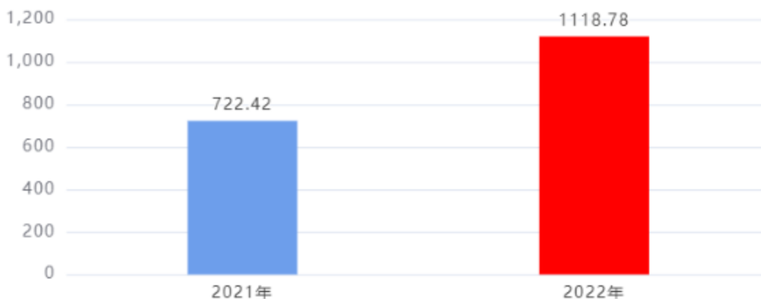
财政拨款收入、支出总计对比图（单位：万元）

2022年度财政拨款收入总计、支出总计均为1,118.78万元，与上年相比收入总计、支出总计均增加396.36万元，增长54.87%，增长的主要原因是：本年度人员经费及中省转移支付经费增加。