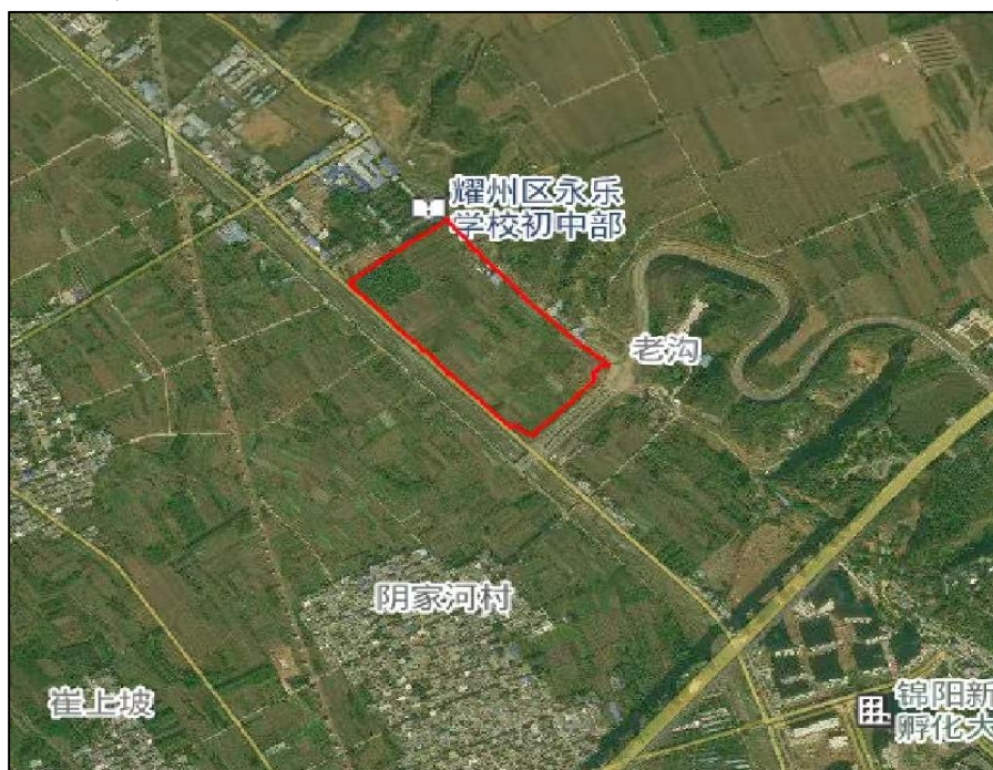
项目区域位置示意图