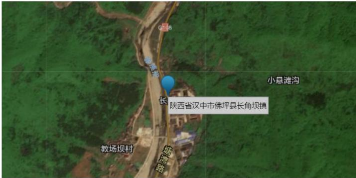
图 1-1 项目所在区位图