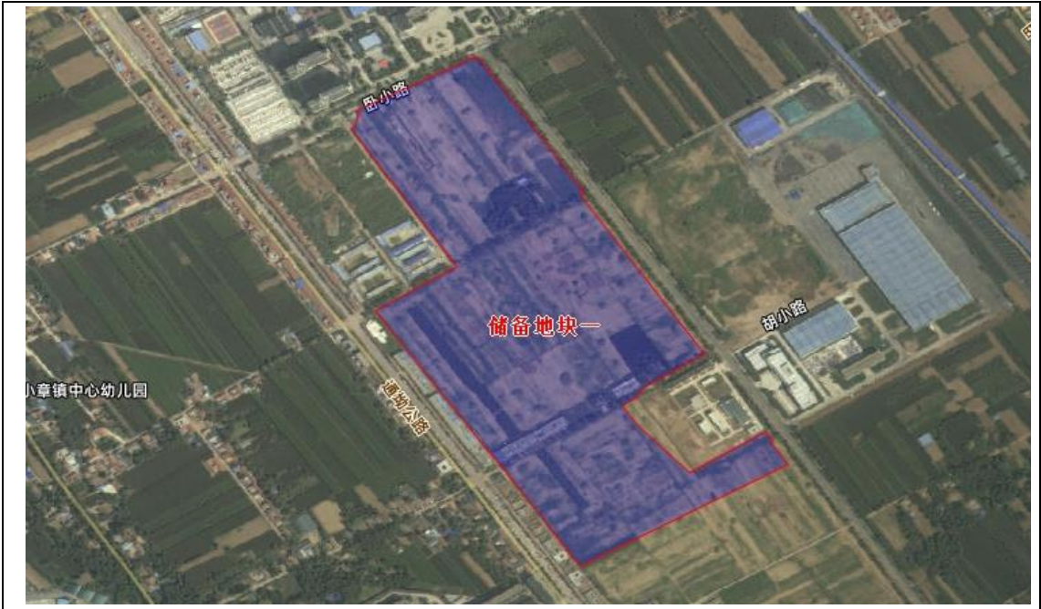
图 1-1 彬州经开区储备项目一区域位置示意图

地块位于新民镇郭村、小章村，项目涉及征收土地面积为 23.728466 公顷（合 355.93 亩），均为农用地，涉及被征收人口约 140 人，可腾空土地面积为 355.93 亩，可出让土地面积 333.83 亩。