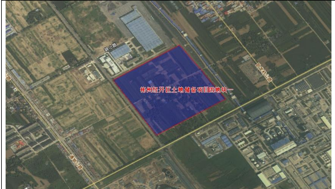
图 1-4 彬州经开区储备项目四地块一区域位置示意图

位于新民镇卧龙村、小章村，项目涉及征收土地面积为 17.163500 公顷（合 257.45 亩），均为农用地，涉及被征收人口约 105 人，可腾空土地面积为 257.45 亩，可出让土地面积 239.82 亩。