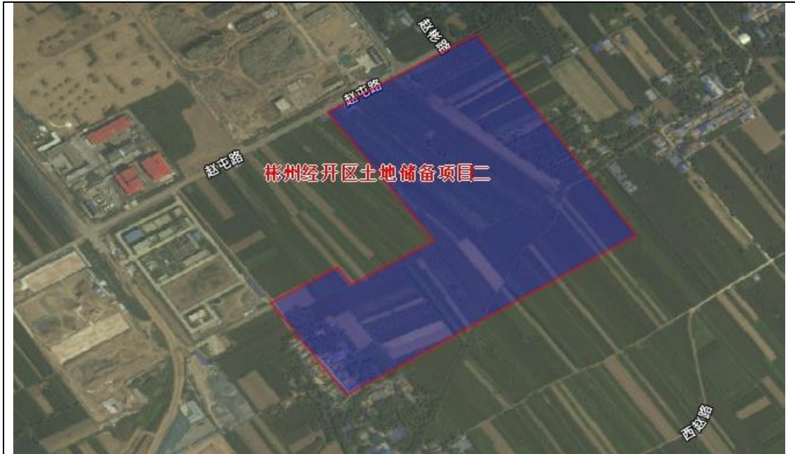
图 1-2 彬州经开区储备项目二区域位置示意图

位于新民镇屯庄村、赵寨村，项目涉及征收土地面积为 20.639100 公顷（合 309.59 亩），均为农用地，涉及被征收人口约 130 人，可腾空土地面积为 309.59 亩，可出让土地面积 309.59 亩。