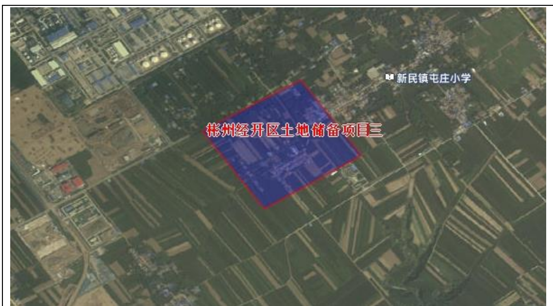
图 1-3 彬州经开区储备项目三区域位置示意图

位于新民镇屯庄村，项目涉及征收土地面积为 24.496900 公顷（合 367.45 亩），均为农用地，涉及被征收人口约 150 人，可腾空土地面积为 367.45 亩，可出让土地面积 367.45 亩。