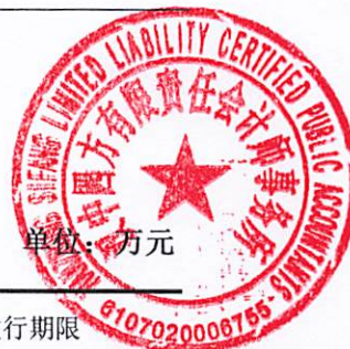
表 6 债券发行计划表