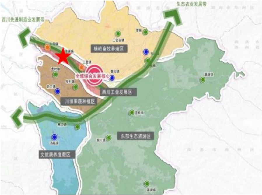
图 4 蓝田县产业发展体系图

补链—强链—固链。结合上位规划、政策导向属性等分析，本项目储备定位人工智能、低空经济、智能智造产业具有良好效益，建设综合性新质生产力智慧园区。其社会效益及经济效益如下。