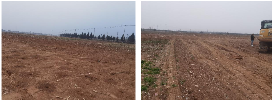
图3 项目地块现状图