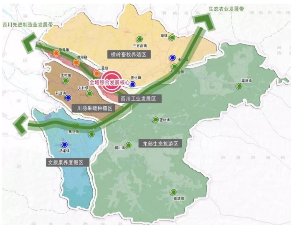
图 4 蓝田县产业发展体系图