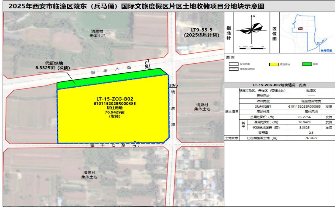
图 4 2025 年西安市临潼区陵东（兵马俑）国际文旅度假区土地收储项目分地块示意图