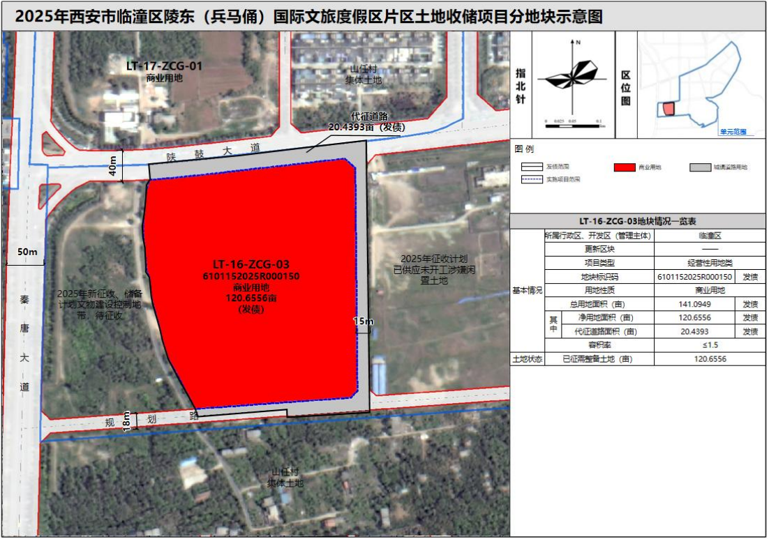
图 3 2025 年西安市临潼区陵东（兵马俑）国际文旅度假区土地收储项目分地块示意图