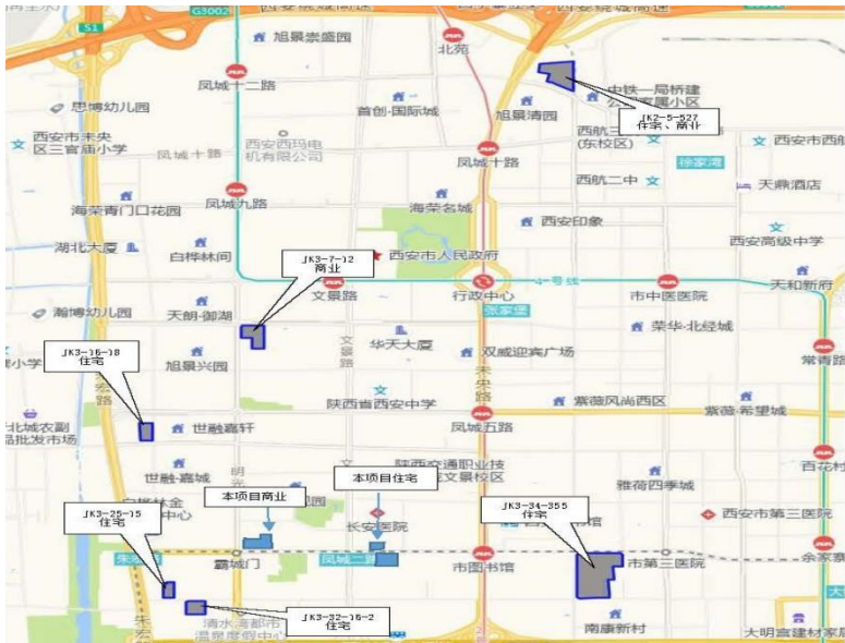
图 4-1 2022 年-2025 年周边土地出让情况位置示意图

(2) 可出让面积：本项目土地收储后，可提供住宅用地 7.013078 公顷（105.1962 亩），商业用地 3.535785 公顷（53.0368 亩）。