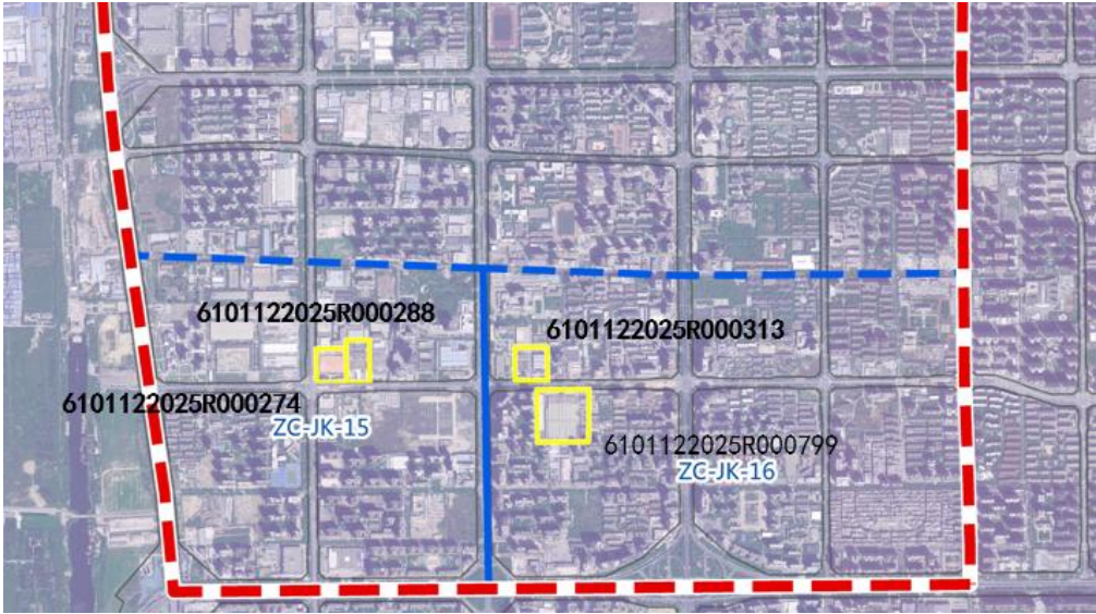
图 1-1 项目规划图