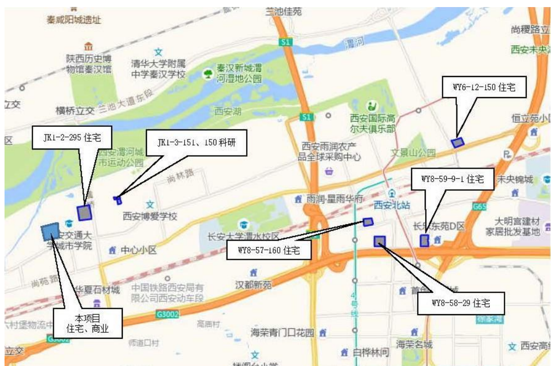
图 4-1 2022 年-2025 年周边土地出让情况位置示意图（一）