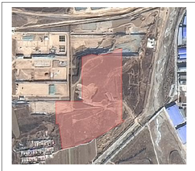
图 1-1 项目地块 1 区域位置示意图

地块位于潼关工业园区核心区片，与国道 310 相通，对外交通便利，产业聚集度高，地块涉及征收土地面积为 11.681018 公顷（175.2153 亩），涉及被征地人口约 175 人，可收储土地面积 11.681018 公顷（175.2153 亩）。