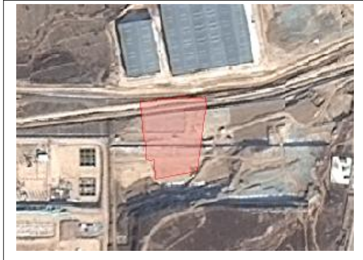
图 1-4 项目地块 4 区域位置示意图

地块位于代字营镇鑫园村，潼关县工业园区核心区，与鑫园村地块 2 相邻，基础设施完备，供水、排水系统齐全。距 310 国道仅 500 米，交通便捷，产业集聚效应突出，发展潜力大。地块涉及征收面积为 1.424811 公顷（21.3722 亩），涉及被征地人口约 20 人，可收储土地面积为 1.424811 公顷（21.3722 亩）。