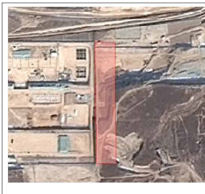
图 1-3 项目地块 3 区域位置示意图

地块位于代字营镇秦王寨社区、鑫园村，处于潼关县工业园区核心区，地处秦晋豫三省交界，区位优势显著。紧邻建成区，基础设施完备，供水、排水系统齐全。距 310 国道仅 500 米，交通便捷，产业集聚效应突出，发展潜力巨大。地块涉及征收面积为 2.170149 公顷（32.5522 亩），涉及被征地人口约 30 人，可收储土地面积为 2.170149 公顷（32.5522 亩）。