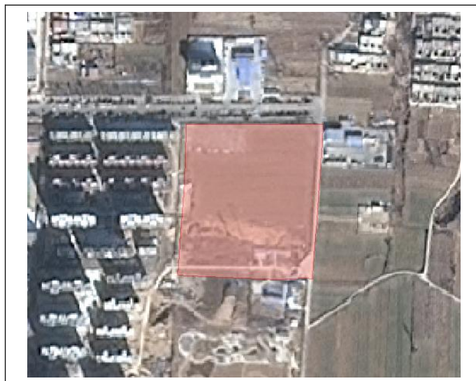
图 1-5 项目地块 5 区域位置示意图

地块位于县城区东侧，双桥大街南侧，区位条件优越，交通便利，环境优美，涉及征收土地面积为 3.964119 公顷（59.4618 亩），涉及被征地人口约 60 人，可收储土地面积为 3.964119 公顷（59.4618 亩）。