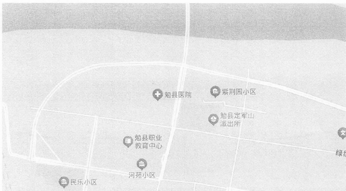
图 1 项目位置图