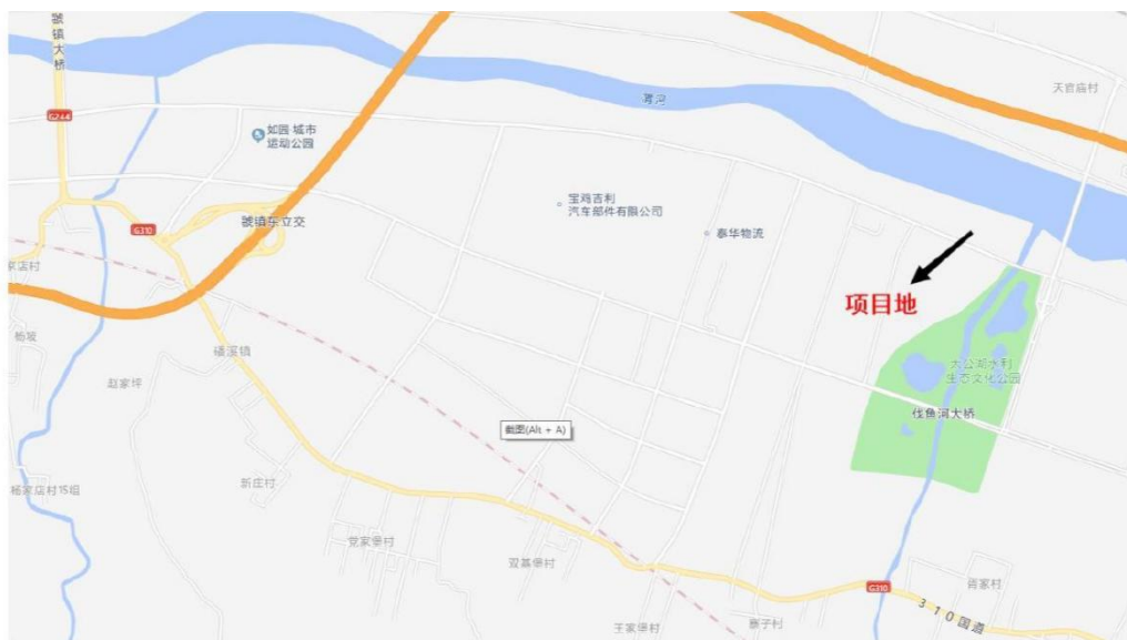
图 1-1 宝鸡市生殖医学中心项目区位图

10. 项目区位情况：宝鸡市高新区，是 1992 年 11 月国务院批准的国家级高新区。高新区以建设一流创新型园区为目标，坚持“产业发展、技术创新、开发建设”三轮驱动，在较短时间实现了超常规发展。近年来主要经济指标同比增长 30%以上，增速连续六年在国家级高新区中名列前茅，已成为关天经济区乃至西部地区基础配套设施完善，生态环境优美，科技企业集聚的高地和拉动区域经济发展的强大引擎。